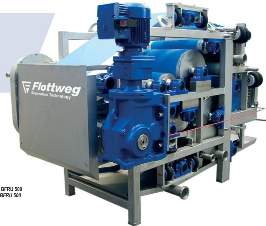
Flottweg Bandpresse Typ BFRU 500 Flottweg Belt Press Type BFRU 500

Technische Daten BFRU 500* / Technical Data BFRU 500*